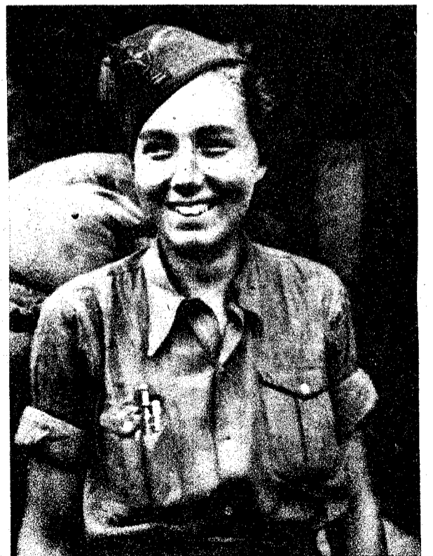
LA GRAN LUCHADORA ANTI-FASCISTA CONOCIDA POR «FANNY», QUE HA RESULTADO GRAVEMENTE HERIDA EN UN ACCIDENTE DE AUTOMÓVIL, CERCA DE TARRAGONA